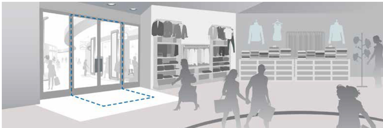
FIGURA 1: ESEMPIO VARCO DI USCITA

xEAS si rivolge principalmente ai punti vendita, ma la sua facilità di utilizzo ne fa una scelta adatta per chiunque necessiti di definire una zona di sorveglianza nella zona di uscita del negozio, effettuando così prevenzione sulle perdite degli articoli. L'utilizzo dell'xEAS è concesso dietro licenza (una tantum) per singolo minipc. Senza tale licenza non è possibile utilizzare xEAS.